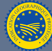
LES PRODUITS BÉNÉFICIAINT D'UNE INDICATION GÉOGRAPHIQUE (IGP)